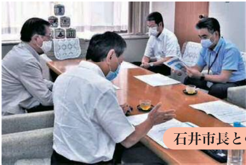
石井市長との会談