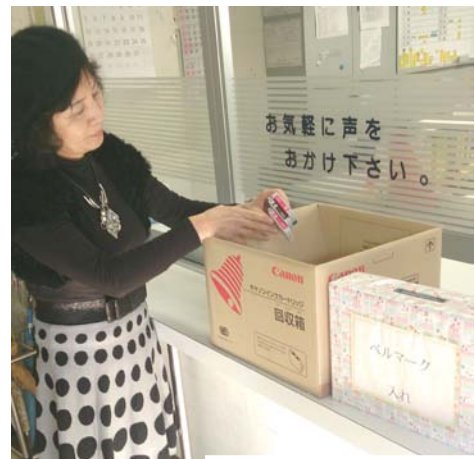
センター入り口の回収箱

生活の中にあるベルマークを見つけてセンターの回収箱や地区の役員の皆様に預けてください。キャノン、ブラザー、エプソンのプリンター用カートリッジもベルマーク対象です。純正に限りますが、使用済みカートリッジの現物をそのまま届けてください。